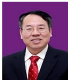
雒建斌院士 清华大学