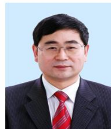
潘复生院士 重庆大学