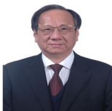
丁文江院士 上海交通大学