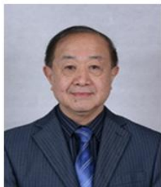
周克崧院士 广州有色金属研究院